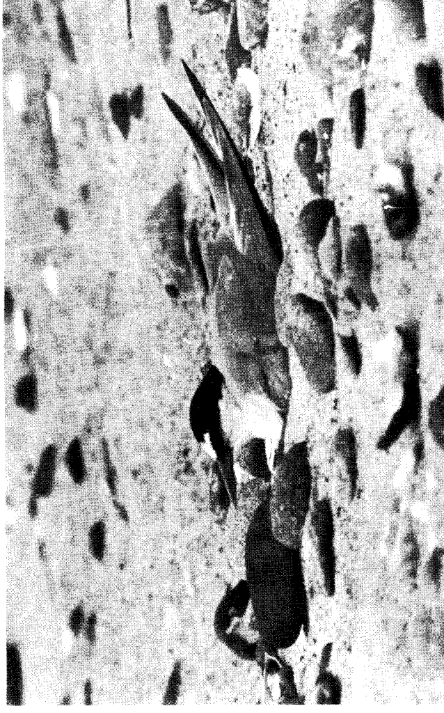
Brütende Zwergseeschwalbe am Strand

25 Brutpaare der auf der " Roten Liste " stehenden Zwergseeschwalben (Stand: 12.6.) sind das bisher herausragende Ergebnis der diesjährigen Brutzeit; es ist die höchste seit den sechziger Jahren festgestellte